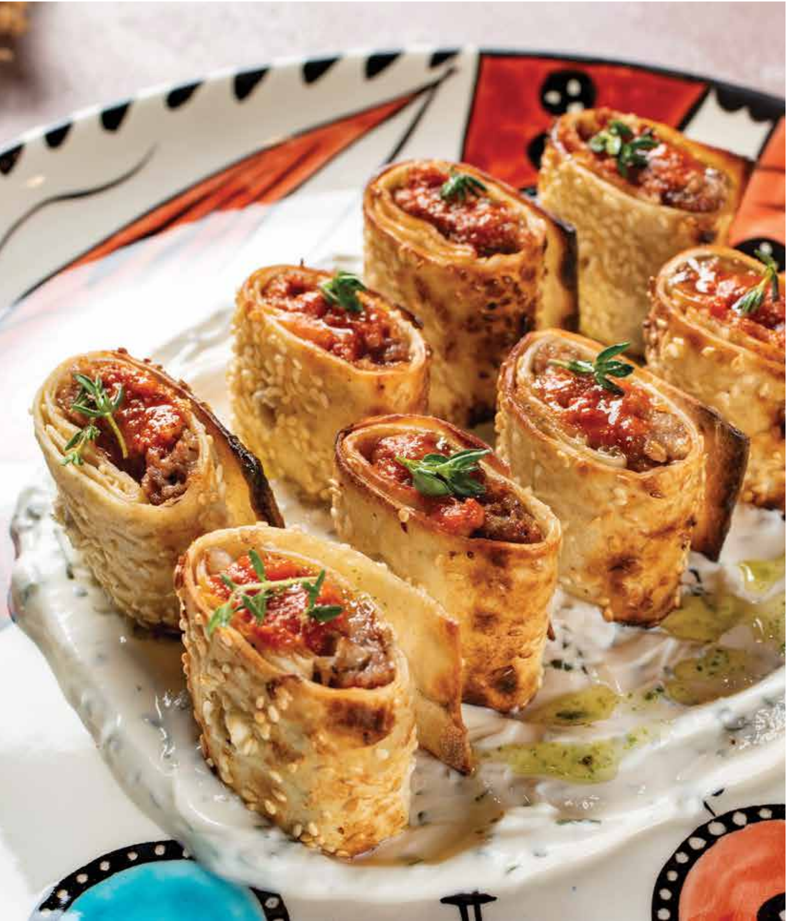
ŞEFİN KEBABI _____