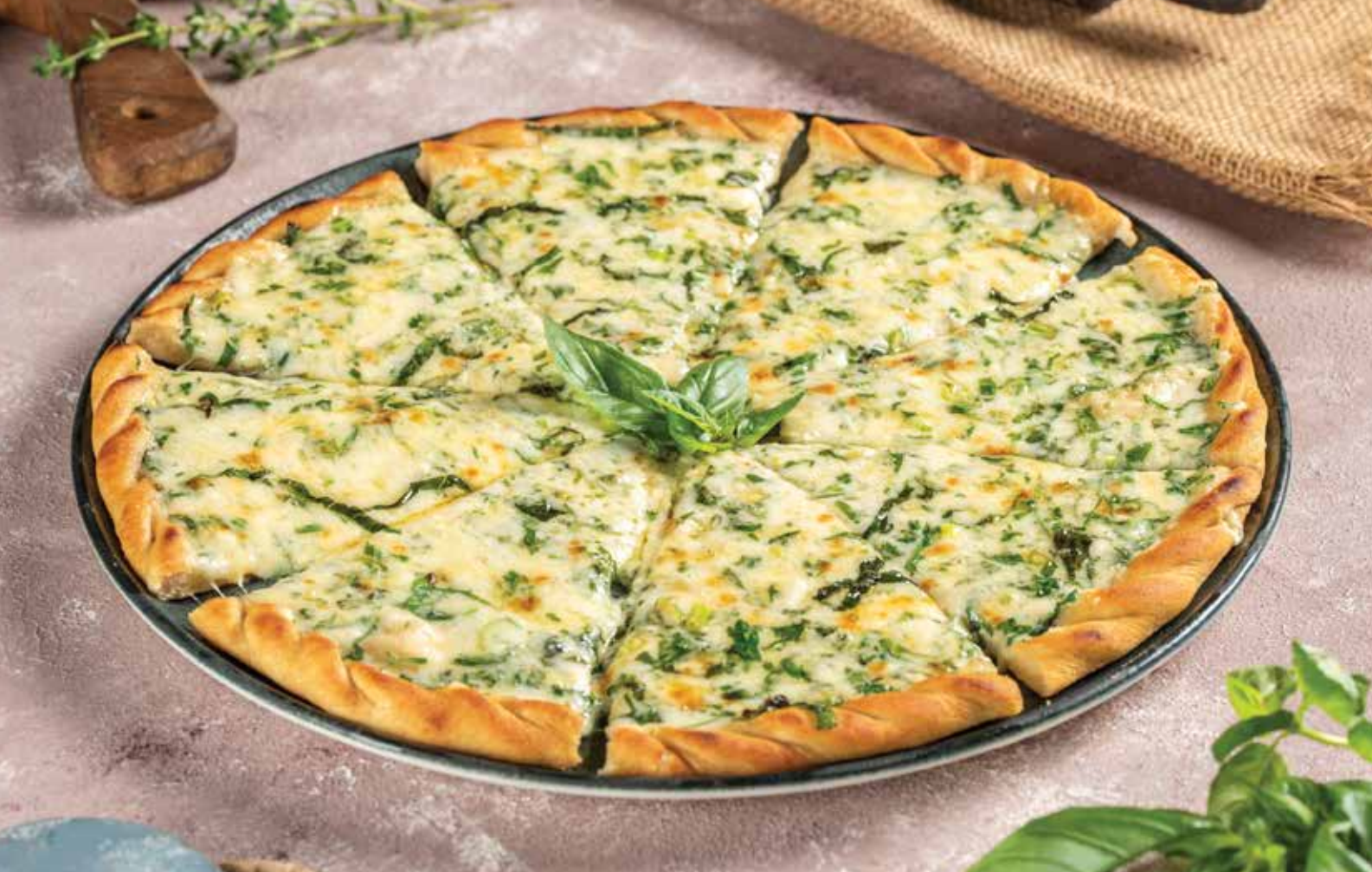
4 PEYNİRLİ OTLU PİDE