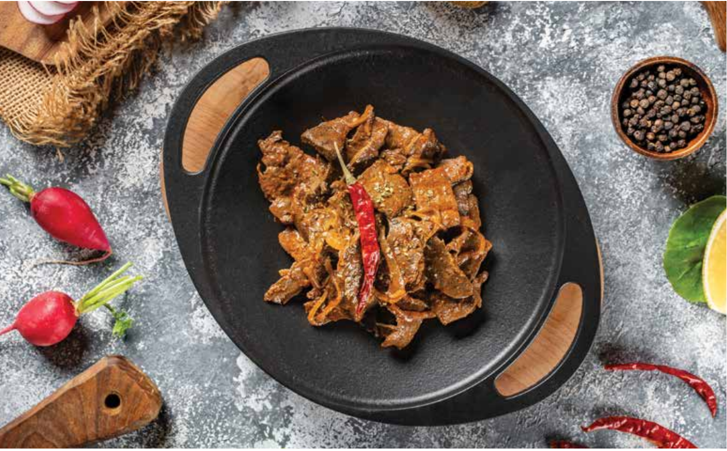
ŞEFİN YAPRAK DANA CİĞERİ