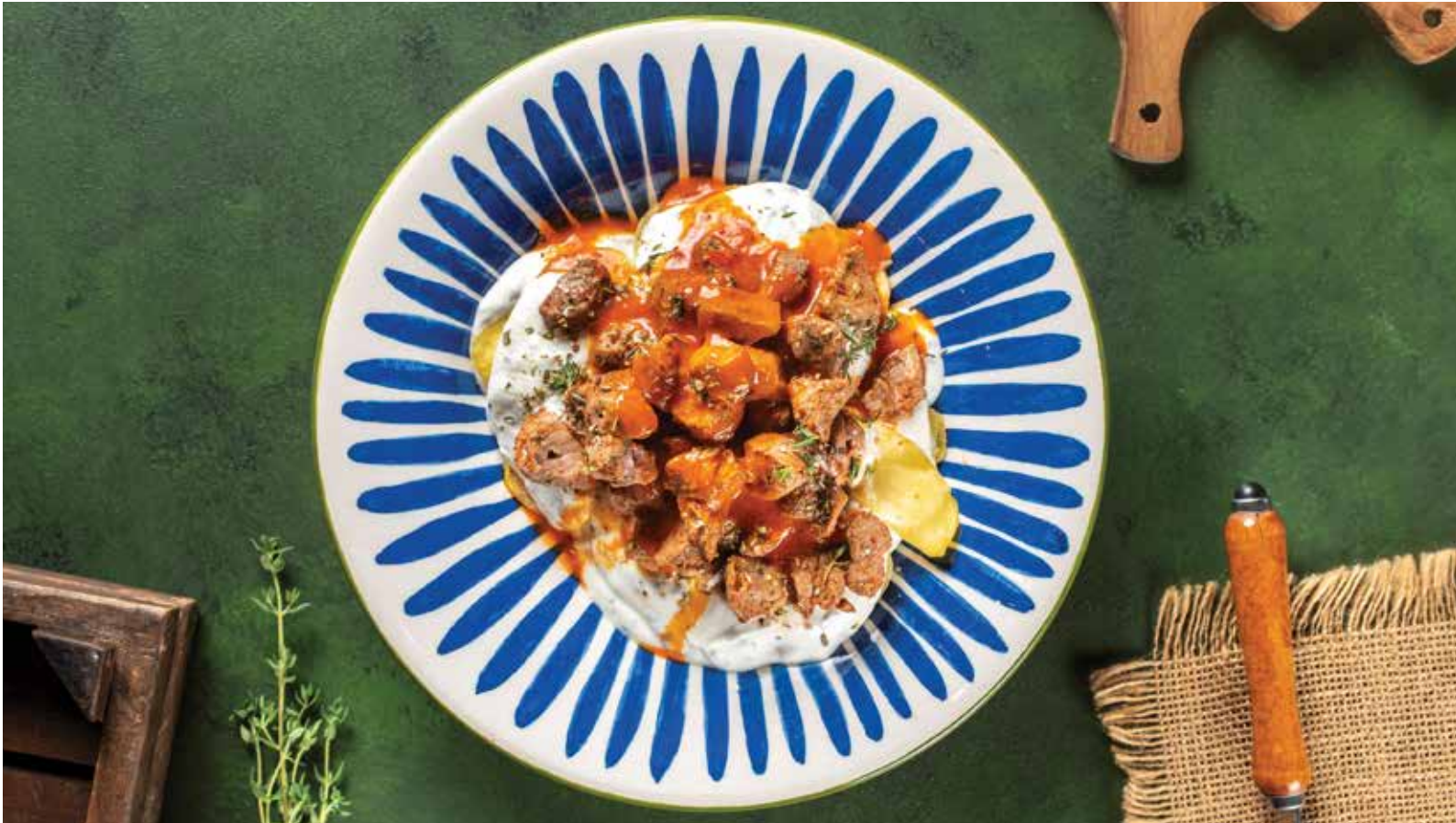
_____ ŞEFİN ÇÖKERTME KEBABI