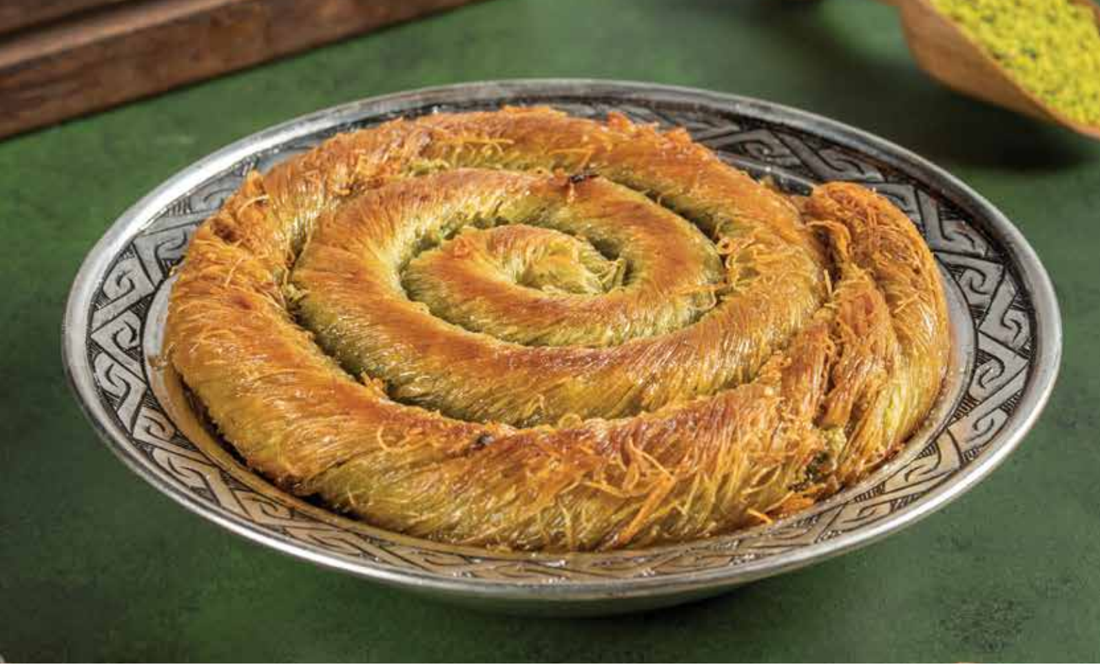
SICAK BURMA KADAYIF