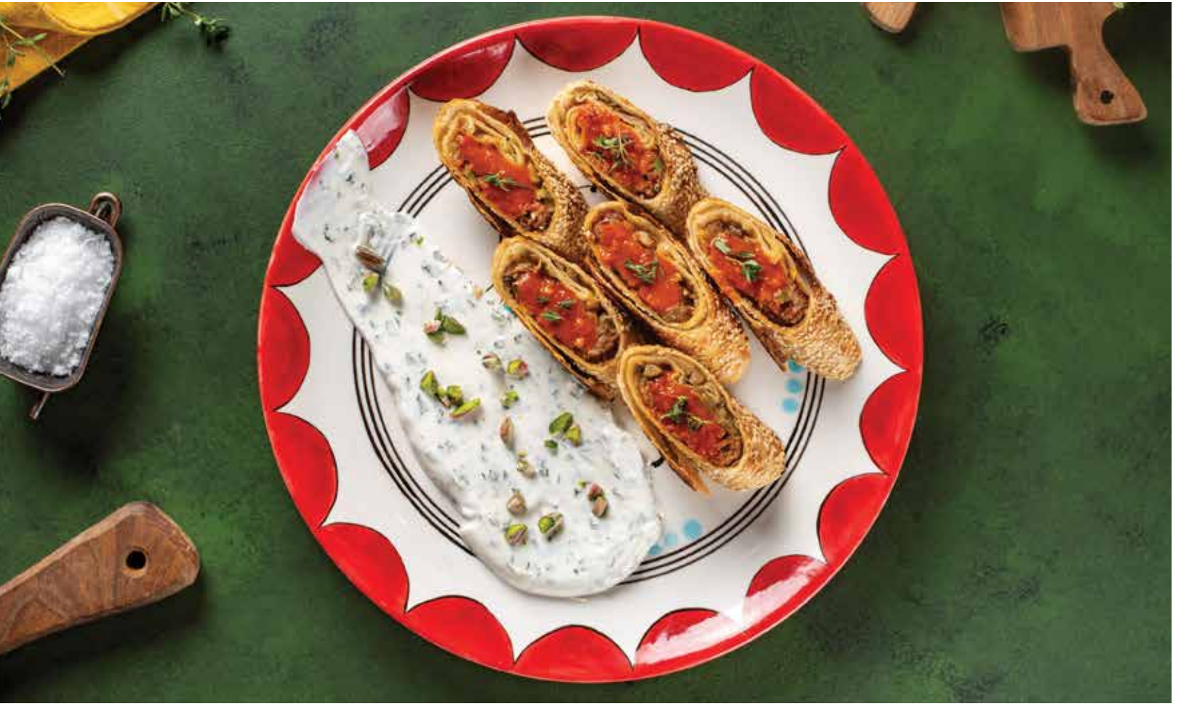
ŞEFİN SARAY KEBABI _____