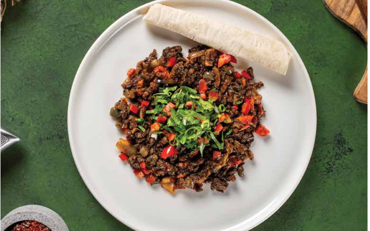
GAZİANTEP CİĞER KAVURMASI