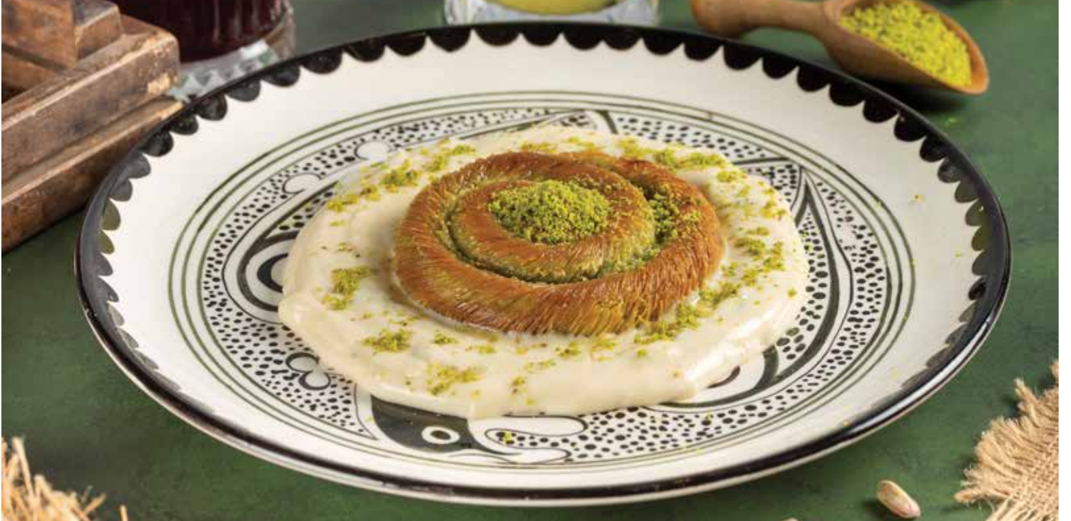
MAGNOLIALI SICAK BURMA KADAYIF