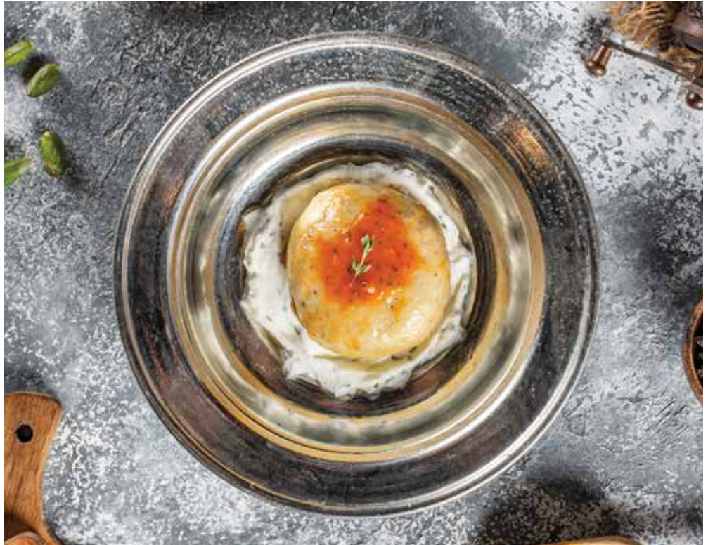
HAŞLAMA İÇLİ KÖFTE