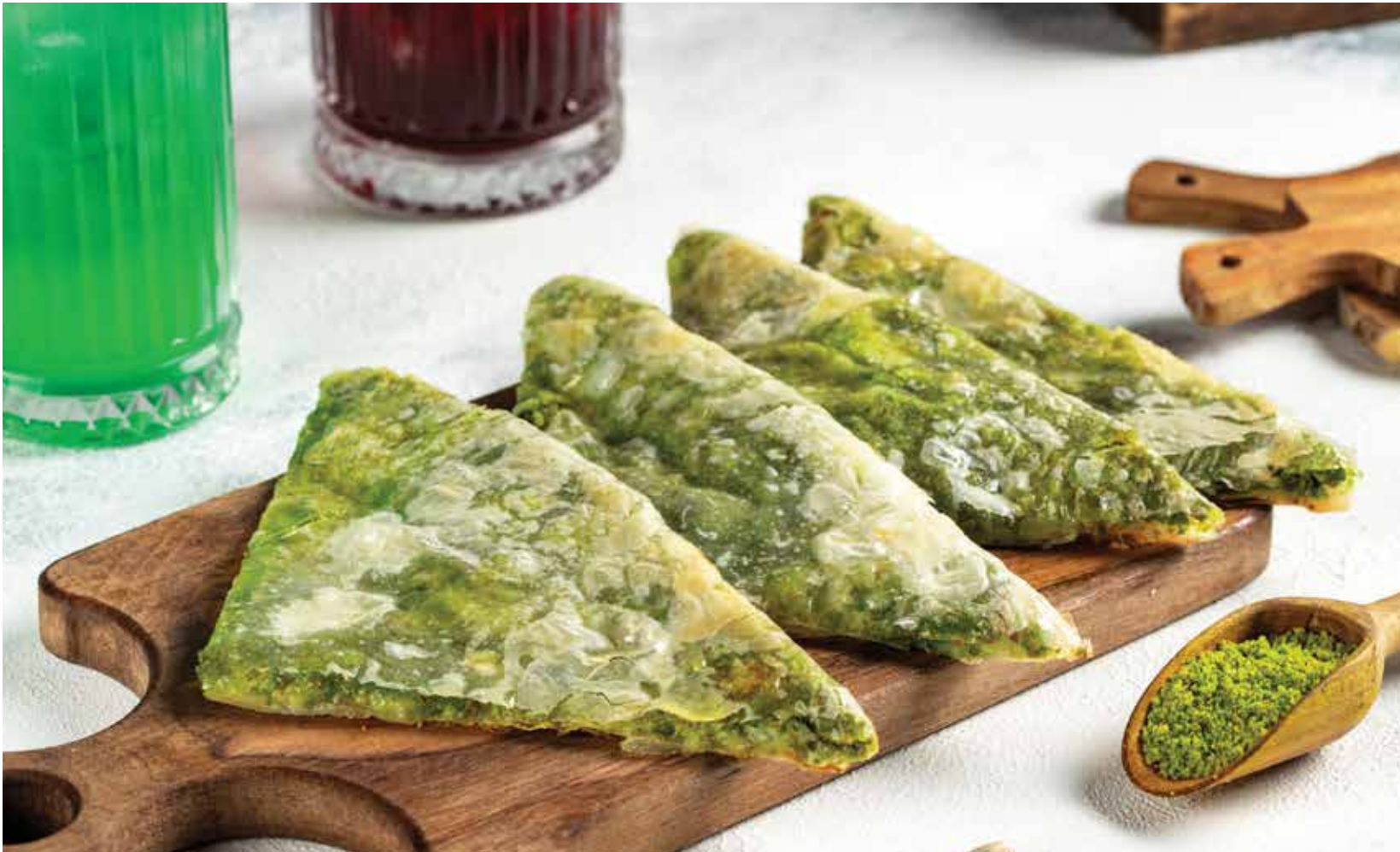
_____ GAZIANTEP KATMERİ