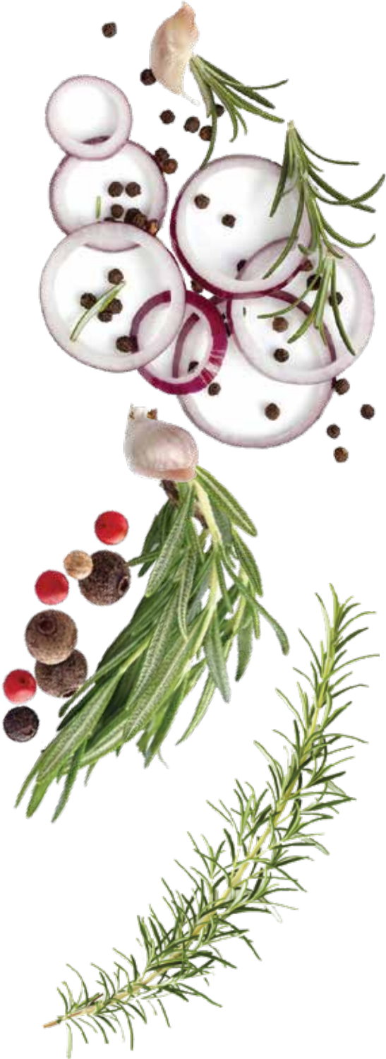
4 veya 6 Kişilik BİRECİK KEBAB SET