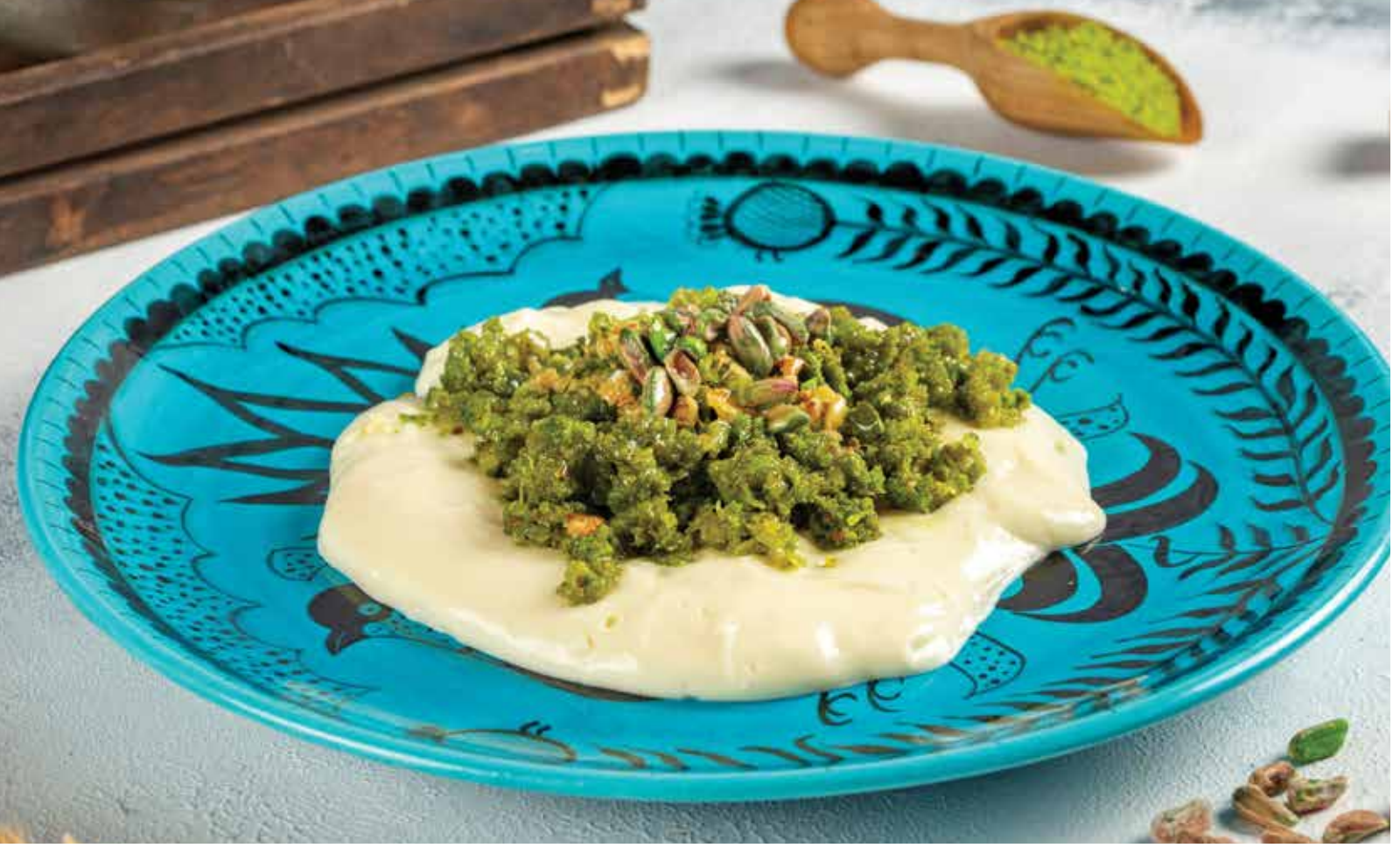
MAGNOLIA FISTIK SARMA _____